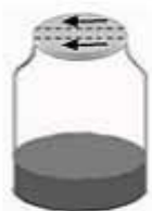
按箭头方向打开西林瓶盖

注意：如有特殊的接种方式、培养时间或培养方式，请详见每种生化鉴定管附带的使用说明。